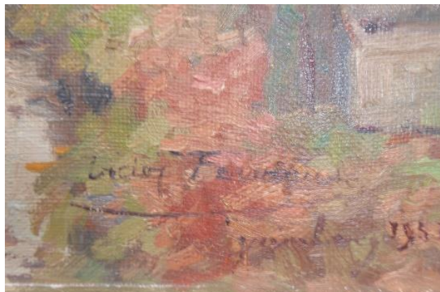
Foto detail signatuur titel en datering.